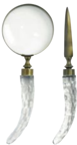
Förstoringsglas/brevkniv 1 375:-