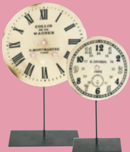
Klocka i plåt från 150:-

Upptäck din personliga stil bland assecoarer, möbler och antikviteter.