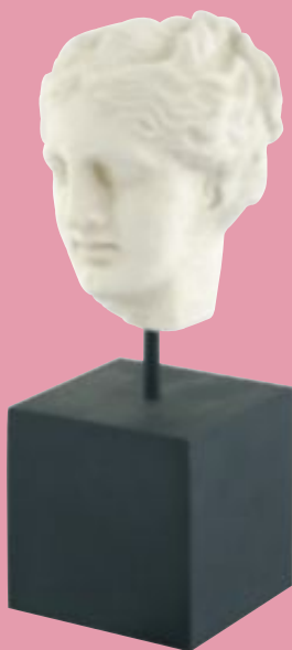
Deesse Grecque 495:-