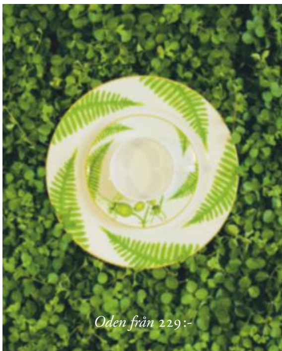
Oden från 229:-