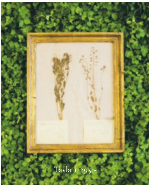
Tavla 1 295:-